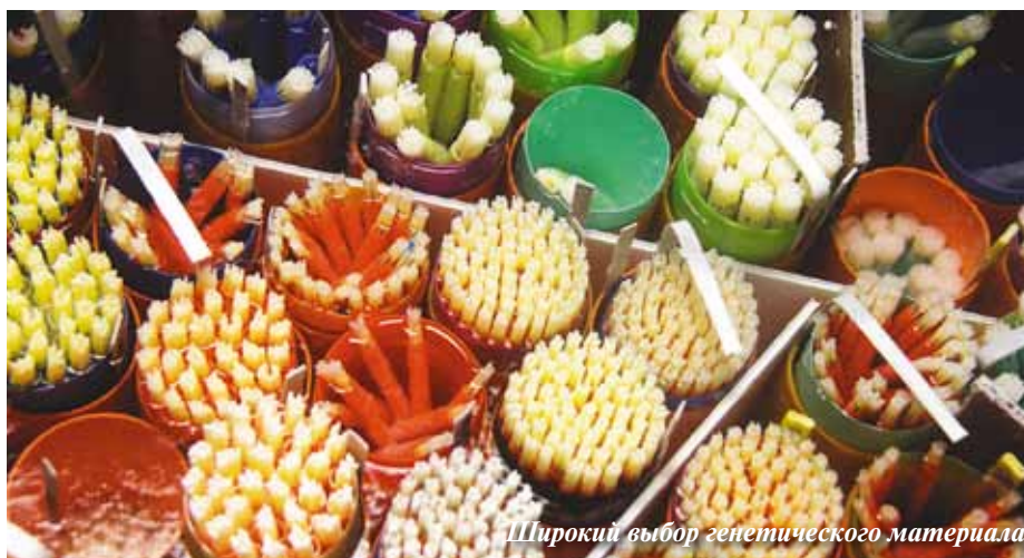
Широкий выбор генетического материала

Во всем мире реклама и продажа генетического материала — это серьезный бизнес и большой рынок. Достаточно беглого взгляда на документы по оценке быка, каталог животных, журнал по молочному скотоводству или связанный с этим веб-сайт, чтобы убедиться в том, что производителям молока предоставлен огромный объем необходимой для работы информации о генетических качествах скота. Помимо множества источников, существует также и немало способов выражения этих данных, например LPI, TPI, NM$, MACE, ISU и т.д., — вариантов очень много.